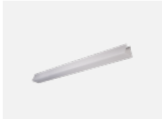
132-51100, K Diffusor 2295 mm