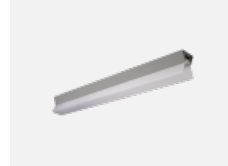
132-50031, S Pendeltubus 1000 mm