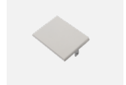
132-50100, S Endkappe