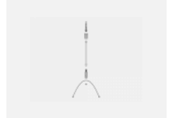
121-00301, N Seilaufhängung 4000mm