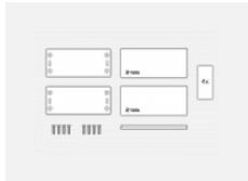
121-20101, W 2xEndkappe - Kunststoff