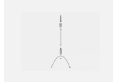
121-00300, N Seilaufhängung 2000mm