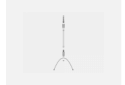
121-00301, N Seilaufhängung 4000mm