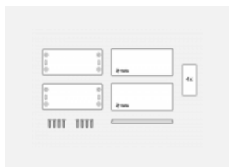
121-20101, B 2xEndkappe - Kunststoff