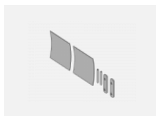
121-00200, N Direkter Verbinder