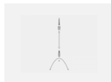
121-00301, N Seilaufhängung 4000mm