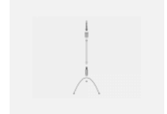
121-00301, N Seilaufhängung 4000mm