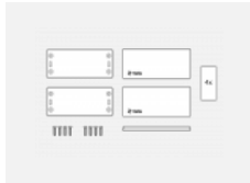
121-20101, B 2xEndkappe - Kunststoff