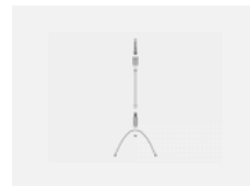
121-00301, N Seilaufhängung 4000mm