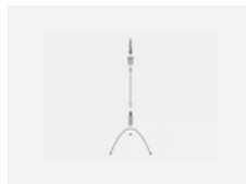
121-00300, N Seilaufhängung 2000mm