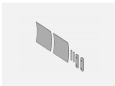
121-00200, N Direkter Verbinder