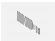
121-00200, N Direkter Verbinder