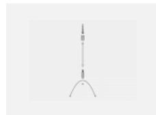
121-00301, N Seilaufhängung 4000mm