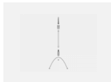
121-00300, N Seilaufhängung 2000mm