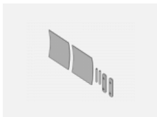
121-00200, N Direkter Verbinder