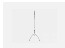
121-00301, N Seilaufhängung 4000mm