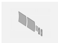
121-00200, N Direkter Verbinder