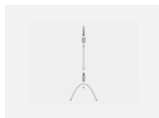
121-00300, N Seilaufhängung 2000mm