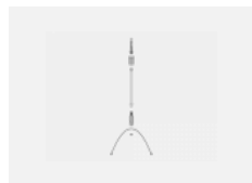
121-00302, N Seilaufhängung 6000mm