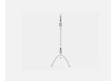
121-00300, N Seilaufhängung 2000mm