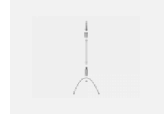
121-00301, N Seilaufhängung 4000mm