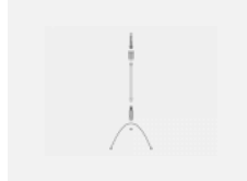
121-00300, N Seilabhängung 2000mm