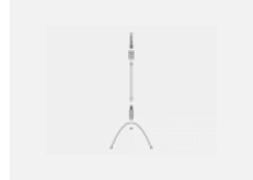
121-00301, N Seilabhängung 4000mm