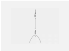
121-00302, N Seilabhängung 6000mm