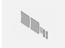
121-00200, N Direkter Verbinder