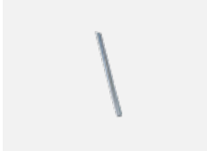
00-00364, K Kabel 5x1,5 4000mm