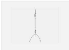
121-00302, N Seilaufhängung 6000mm