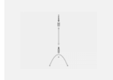
121-00301, N Seilaufhängung 4000mm