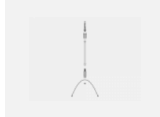
121-00300, N Seilaufhängung 2000mm