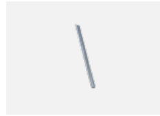
00-00363, K Kabel 5x1,5 2000mm