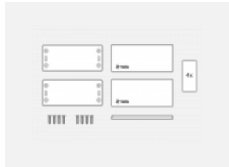
121-20101, S 2xEndkappe - Kunststoff