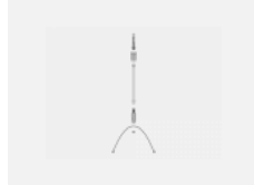
121-00300, N Seilaufhängung 2000mm