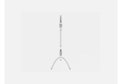
121-00301, N Seilaufhängung 4000mm