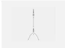
121-00302, N Seilaufhängung 6000mm