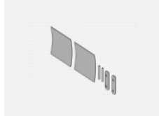
121-00200, N Direkter Verbinder