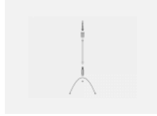
121-00300, N Seilaufhängung 2000mm