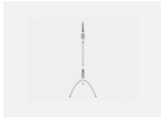
121-00302, N Seilaufhängung 6000mm