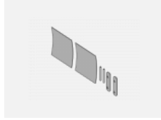
121-00200, N Direkter Verbinder