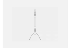
121-00301, N Seilaufhängung 4000mm