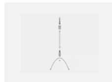
121-00301, N Seilaufhängung 4000mm