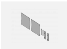
121-00200, N Direkter Verbinder