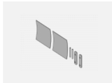
121-00200, N Direkter Verbinder