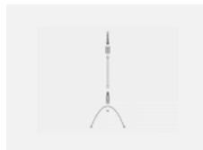
121-00300, N Seilaufhängung 2000mm