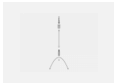
121-00302, N Seilaufhängung 6000mm