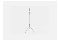
121-00301, N Seilaufhängung 4000mm