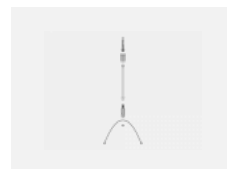
121-00301, N Seilaufhängung 4000mm