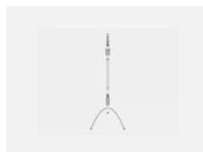
121-00300, N Seilaufhängung 2000mm