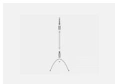
121-00302, N Seilaufhängung 6000mm