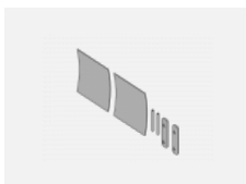
121-00200, N Direkter Verbinder