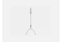
121-00301, N Seilaufhängung 4000mm