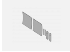
121-00200, N Direkter Verbinder