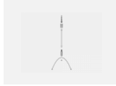
121-00300, N Seilaufhängung 2000mm