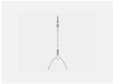
121-00302, N Seilaufhängung 6000mm