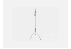
121-00301, N Seilaufhängung 4000mm