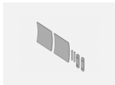
121-00200, N Direkter Verbinder