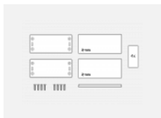
121-20101, W 2xEndkappe - Kunststoff