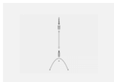
121-00302, N Seilaufhängung 6000mm