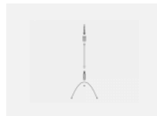
121-00300, N Seilaufhängung 2000mm