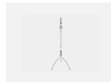
121-00301, N Seilaufhängung 4000mm