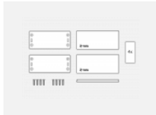
121-20101, S 2xEndkappe - Kunststoff