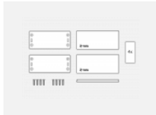
121-20101, W 2xEndkappe - Kunststoff