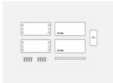
121-20101, B 2xEndkappe - Kunststoff