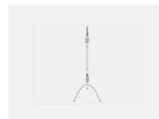
121-00301, N Seilaufhängung 4000mm