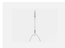
121-00300, N Seilaufhängung 2000mm