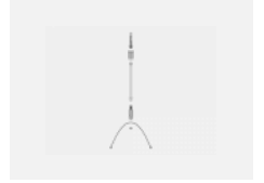
121-00301, N Seilaufhängung 4000mm