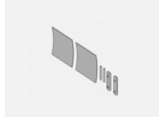
121-00200, N Direkter Verbinder