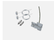
00-51301, S Set für Aufhängung in 3Ph-Schiene für dimmbare Leuchten