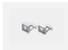
00-20700, B Wandhalter (2 Stk) Lipo/Lina