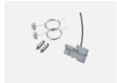
00-51301, W Set für Aufhängung in 3Ph-Schiene für dimmbare Leuchten