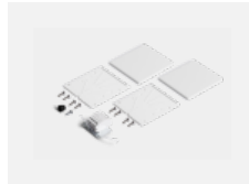
00-20103, B 2xEndkappe - Kunststoff, Klemmleiste 5-polig, Kabeldurchführung; Lipo80/Lina80