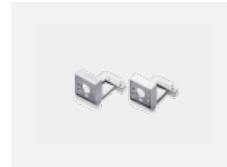
00-20700, S Wandhalter (2 Stk) Lipo/Lina