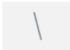
00-00363, K Kabel 5x1,5 2000mm