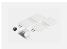
00-20101, W 2xEndkappe - Metall, Klemmleiste 5-polig, Kabeldurchführung; Lipo80/Lina80