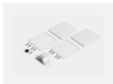
00-20103, W 2xEndkappe - Kunststoff, Klemmleiste 5-polig, Kabeldurchführung; Lipo80/Lina80