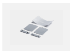
00-00200, N Direkter Verbinder