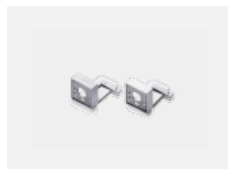
00-20700, W Wandhalter (2 Stk) Lipo/Lina