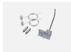
00-51300, W Set für Aufhängung in 3Ph-Schiene für nicht dimmbare Leuchten