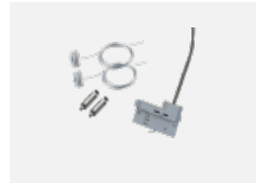
00-51300, W Set für Aufhängung in 3Ph-Schiene für nicht dimmbare Leuchten