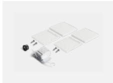
00-20101, W 2xEndkappe - Metall, Klemmleiste 5-polig, Kabeldurchführung; Lipo80/Lina80