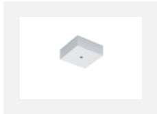
00-00370, W Deckenkappe 80x80x32mm