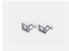
00-20700, W Wandhalter (2 Stk) Lipo/Lina