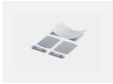
00-00200, N Direkter Verbinder