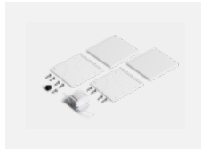
00-20103, W 2xEndkappe - Kunststoff, Klemmleiste 5-polig, Kabeldurchführung; Lipo80/Lina80