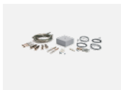
00-00333, W Seilaufhängungsset- 4 Seile 2000mm, Kabel 5x0,75mm, Baldachin