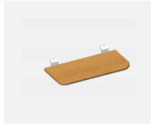
109-0004, WD Wandbrett