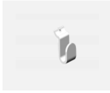
109-0003, W Haken