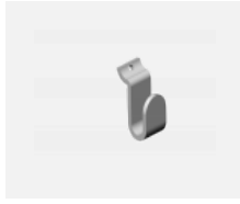
109-0003, S Haken