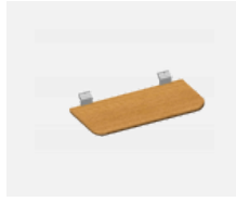
109-0004, SD Wandbrett