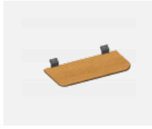
109-0004, BD Wandbrett