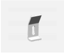
109-0001, F Wandhalter