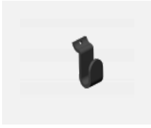
109-0003, B Haken