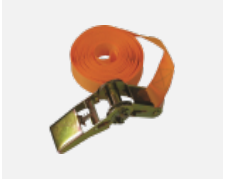
108-0004 Spanngurt für die Rundleuchten INDI