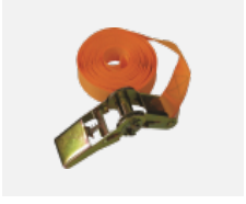
108-0004 Spanngurt für die Rundleuchten INDI