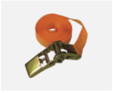
108-0004 Spanngurt für die Rundleuchten INDI