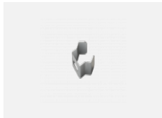
108-0002, F Wandaufhängung - 108-301K