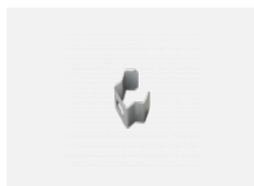
108-0002, F Wandaufhängung - 108-301K