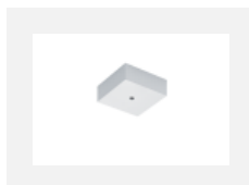
00-00370, W Deckenkappe 80x80x32mm