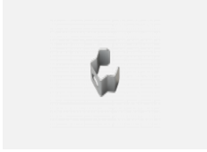
108-0002, F Wandaufhängung - 108-301K