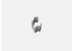
108-0002, F Wandaufhängung - 108-301K