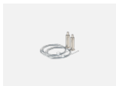
101-0007, N Seilaufhängung 4000 mm, 2 Seile